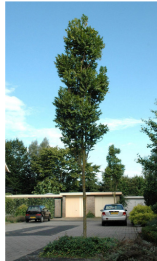
Koelreuteria paniculata 'Fastigiata' (vaantjesboom)

Deze smal opgaande, zuilvormige boom heeft een mooie herfstverkleuring in oranje, rode en purpere tinten.