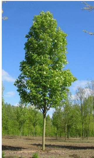
Acer rubrum 'Scanlon' (rode esdoorn)

Dit is een middelgrote boom met een compacte, smalle, zuilvormige kroon. De hoogte is tien tot twaalf meter en de breedte circa vier meter. De stam is grijs en de jonge twijgen zijn roodbruin. Er is een herfstverkleuring in purper en oranje tinten.