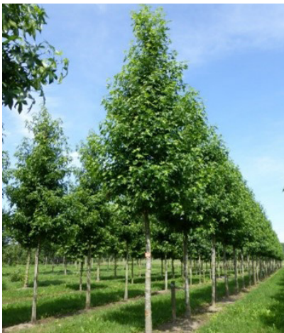
Liquidambar styraciflua 'Worplesdon' (amberboom)

De bladeren zijn glanzend groen met in de herfst een rode tot purperrode bladverkleuring.