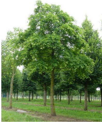
Nyssa sylvatica (zwarte tupeloboom)

In de herfst kleurt deze boom aantrekkelijk rood tot donker wijnrood.