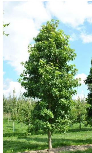
Liquidambar styraciflua 'Fastigiata' (amberboom)

Deze boom heeft een slanke, zuilvormige kroon die vrij open is van structuur waardoor er weinig licht wegvalt. De boom wordt redelijk hoog opgesnoeid eens deze wat groter is zodat er op latere leeftijd geen problemen ontstaan qua lichtinval. Het blad is opvallend gekroesd en vaak gedraaid.