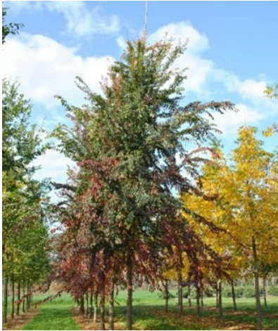
Ulmus frontier (olm)

Een middelgrote boom met aanvankelijk een opgaande, piramidale kroon en een goede doorgaande harttak. Volgroeide bomen krijgen een ovale kroon en worden zes tot tien meter hoog.