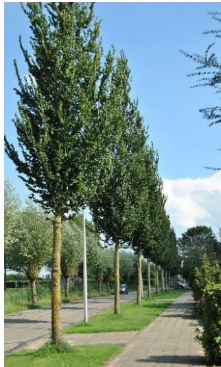
Ulmus 'Columella' (zuiliep)

Dit is een middelgrote boom met een compacte, smalle, zuilvormige kroon. De hoogte is tien tot twaalf meter en de breedte circa vier meter. De stam is grijs en de jonge twijgen zijn roodbruin. Er is een herfstverkleuring in purper en oranje tinten.