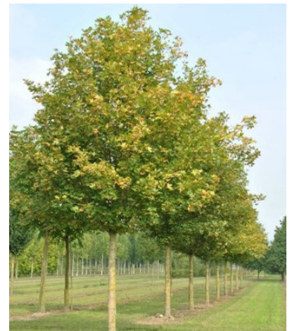
Acer campestre (veldesdoorn)

Behalve een sierlijk blad heeft de boom ook een mooie groeiwijze met iets afhangende twijgen.