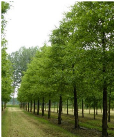
Alnus glutinosa 'Laciniata' (zwarte els)

De kroon groeit aanvankelijk smal met een doorgaande rechte stam. Op latere leeftijd wordt de kroon tussen twaalf en vijftien meter hoog. De herfstkleur is abrikooskleurig, oranje tot oranjerood.