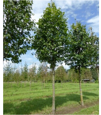
Sorbus torminalis (elsbes)

De herfstkleur maakt deze boom heel geliefd want hij tooit zich uitzonderlijk mooi in donkerrode, oranje en soms gele tinten.